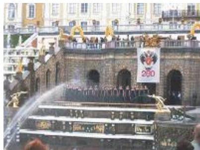
■ Петродворец. Выступает хор Университета